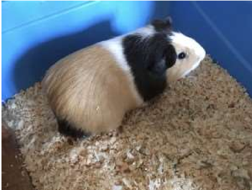
Basilic, mâle castré de l'été 2018, chez Magali