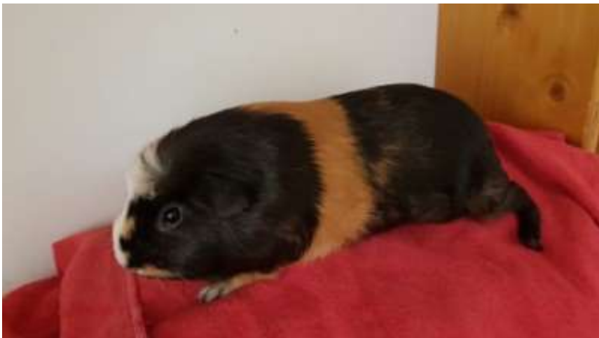
Squick, mâle castré de l'automne 2017, chez Tatiana