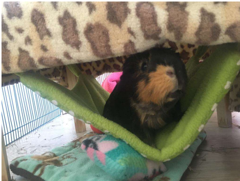
Lily, boule sous le cou, suspicion de tumeur thyroïdienne.