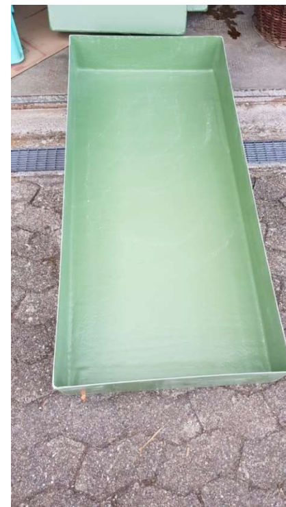
Les nouveaux bacs sur mesure