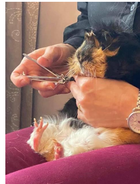
Mon cher Porc-Epic et sa copine Snoopy se sont dévoués aux démonstrations de coupe de griffe, sexage, contrôle des dents