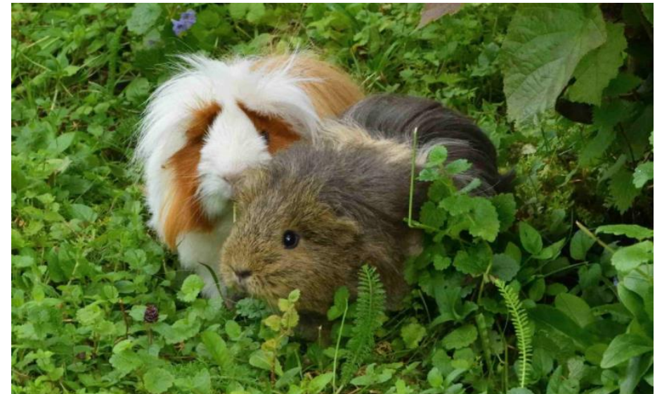
Des nouveaux pensionnaires du CRACI chez Sonja et Walther