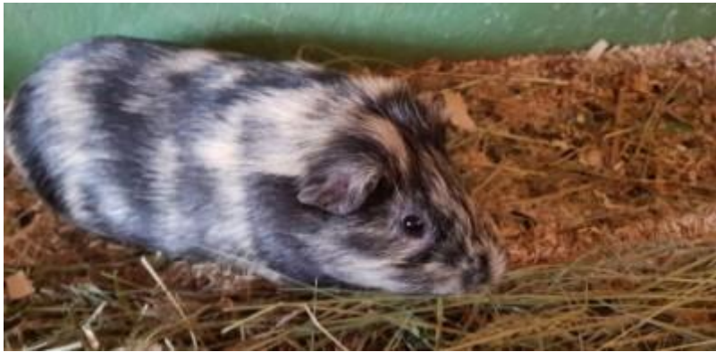
M. Gold, mâle castré de l'été 2020