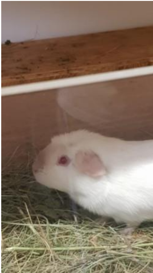
Mousse, mâle castré de mai 2020