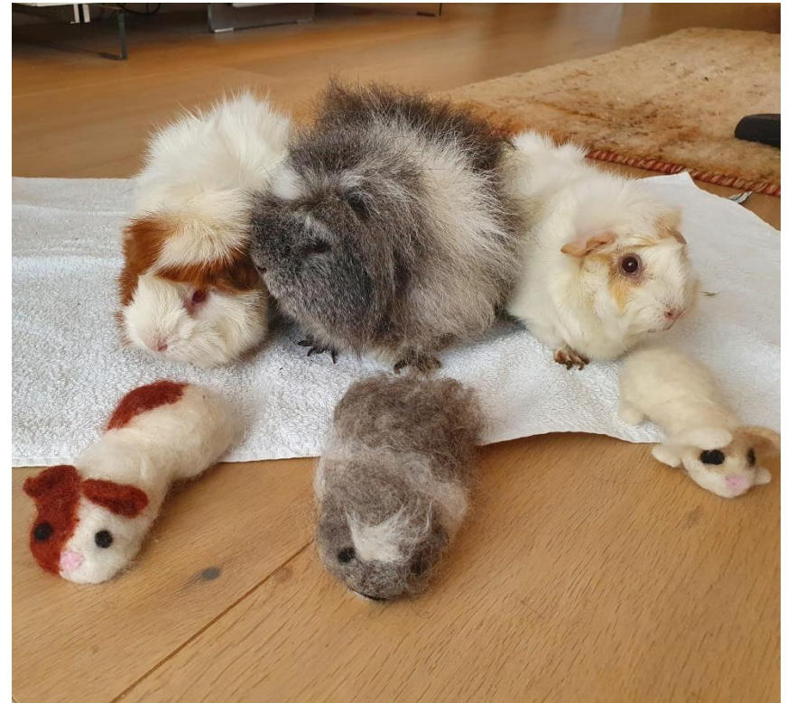
Copie conforme en laine feutrée