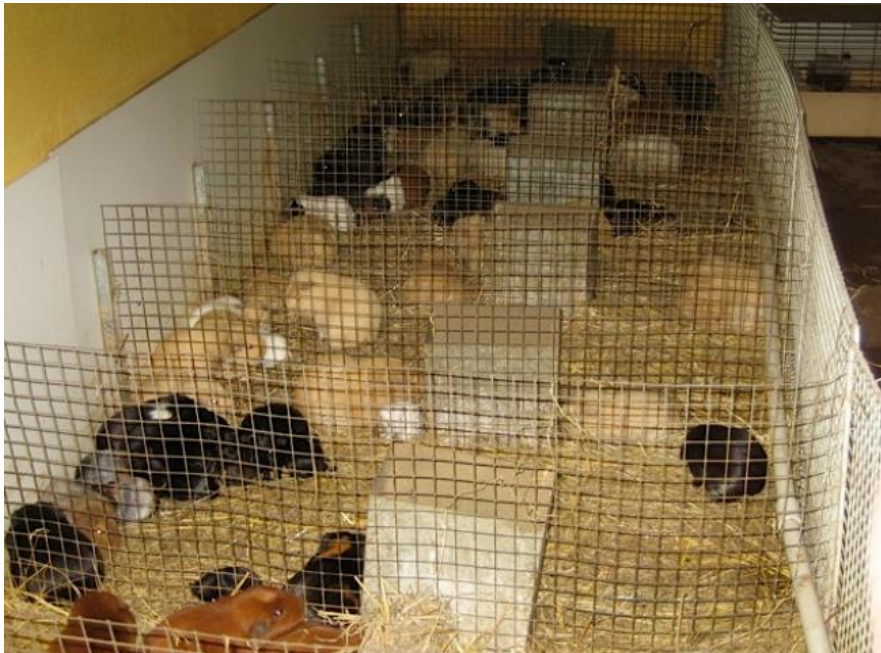
Ça c'est de l'élevage