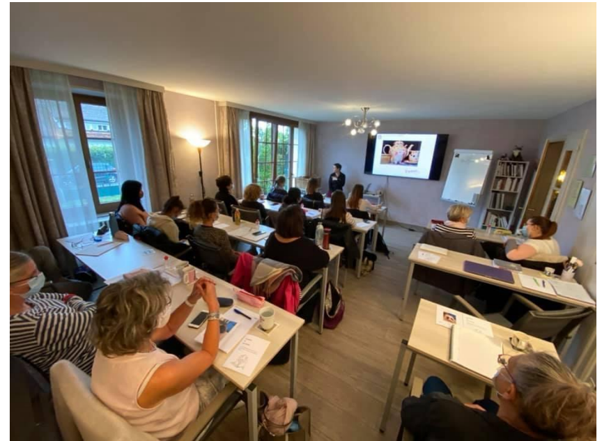
Une très agréable salle de cours vous attend au Monde du Chat

Contact : Monde du chat, Mme Marylène Wassenberg www.moneduchat.ch