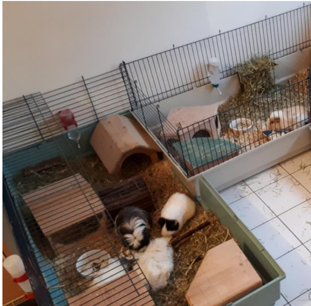
Des heureux vacanciers