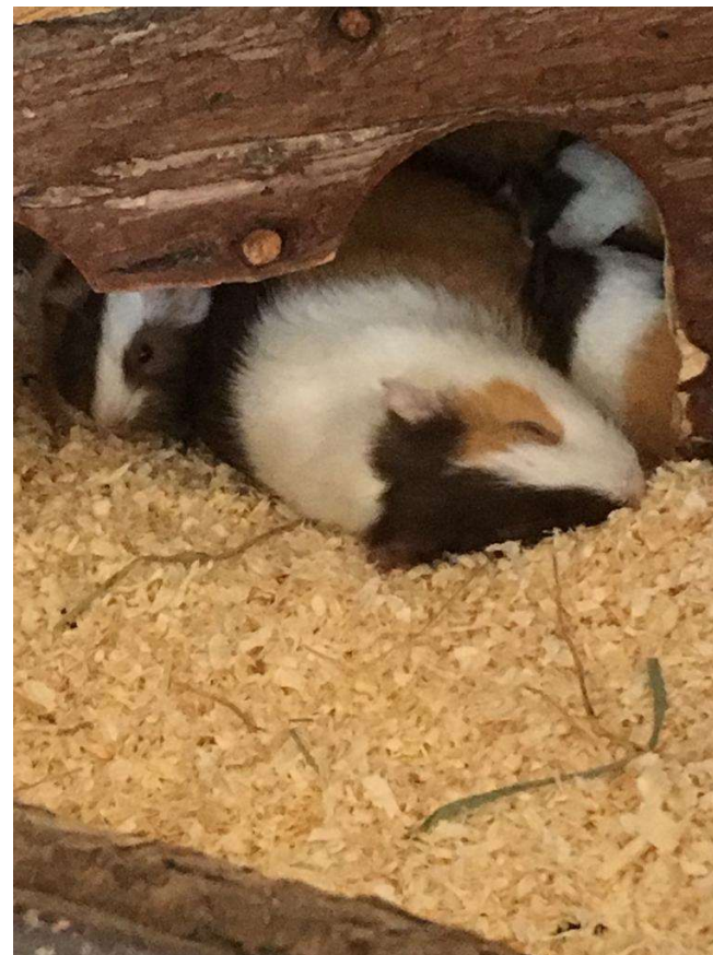
Une maman du séquestre qui se repose, ça fatigue ces petits !

Je persiste à penser que les animaux ne devraient pas être adoptables par des personnes qui ne sont déjà pas capables de s'occuper d'elles-mêmes. Bien entendu les animaux font du bien à ces personnes, mais est-ce que l'état psychique et émotionnel d'une personne sous tox et curatelle peut faire du bien à un animal? J'en doute fort malheureusement.