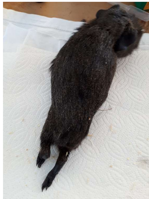
A son arrivée...

mais l'essentiel est là ; Spaghetti est un joli chonchon joyeux et curieux, qui cherche une copine pour partager sa nouvelle vie.