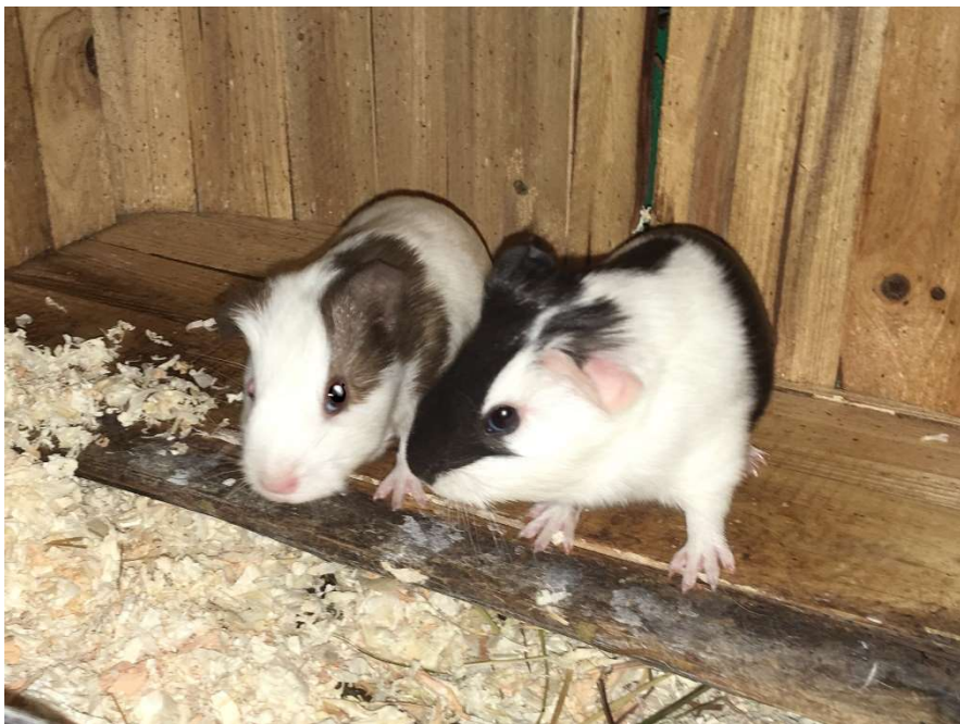
Des ptits nouveaux

Nous supposons que tout a démarré par un couple... comme d'habitude