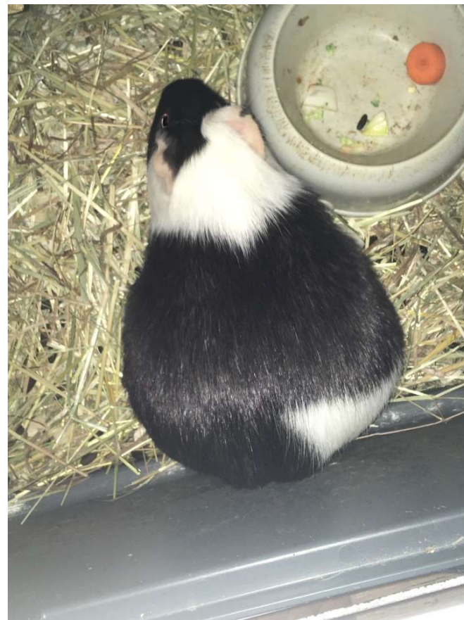
Une pauvre maman qui attend la mise-bas avec impatience